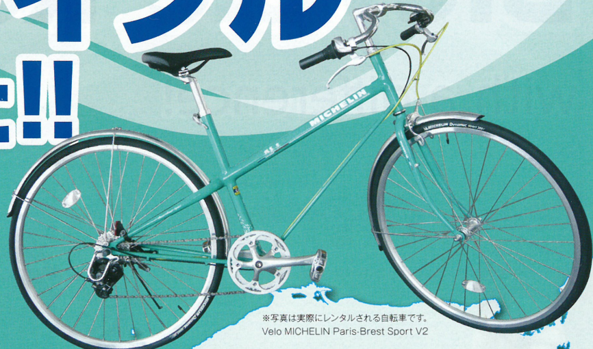
※写真は実際にレンタルされる自転車です。 Velo MICHELIN Paris-Brest Sport V2

※乗り捨てられる道後温泉各旅館は、下記「手ぶら観光便」の17か所です。 ※このレンタサイクルをアロニーに乗せる場合は、追加の車両運賃をいただきます(松山〜呉・広島航路に限る)。 ※スーパーマーケットには自転車を利用すればできません。